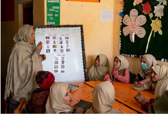
Vorlesen mit Zeichensprache