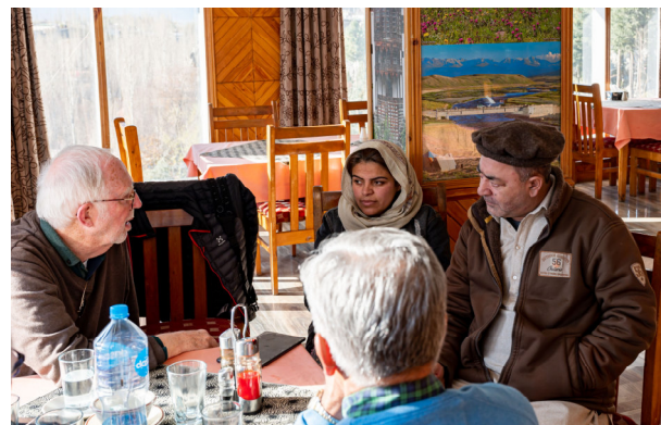
Gespräche mit Deputy Commissioner SKARDU DISTRICT, Director Health,