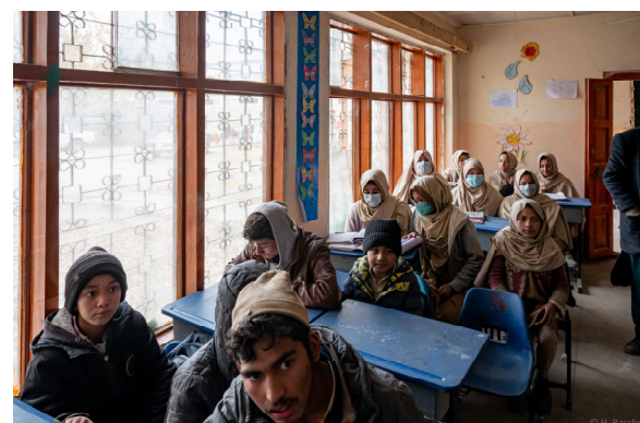
Klasse der älteren Schüler