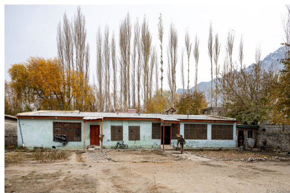
Anflug auf SKARDU - NANGA PARBAT NARJIS KHATOON SCHOOL FOR DEAF