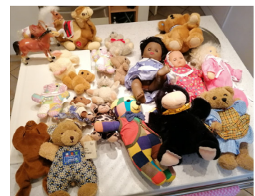
Medizinisches Werkzeug, Puppen und Teddybären

Leider ist bei einem Jungen der Hörverlust zu groß und sein Alter zu fortgeschrittenen, um eine Versorgung mit einem Cochlea Implantat anzudenken und darauf vorbereitend ein Hörgerät anzupassen. In diesem Zusammenhang werden wir in lokalen Medien mit einer Informationskampagne tätig werden. Das Wissen um frühkindliche Hörprobleme und mögliche Maßnahmen muß aufwachsen. Wir beabsichtigen, so bald möglich mit unseren Partnern in PAKISTAN eine Informationskampagne zu starten, um die Menschen bis in die Dörfer darüber zu informieren, wie wichtig es ist, schon Neugeborene auf Hörfähigkeit zu untersuchen. Hören ist Voraussetzung für Sprechen, Schulbesuch und Teilhabe am Leben.