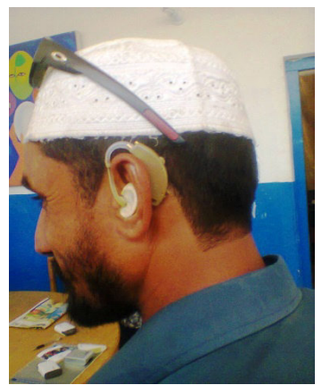
100 Brillen und 12 Hörgeräte für Bedürftige in PESHAWAR und MEERKOH