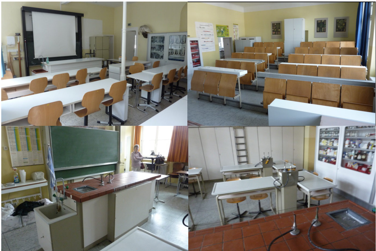
Ein Teil der Ausstattung aus dem Gymnasium in EUTIN

Das Carl-Maria-von-Weber-Gymnasium EUTIN wird im Oktober die komplette Ausstattung von 3 Hörsälen und 3 Arbeitsräumen (Physik, Chemie und Biologie) spenden. Auf diese 'gewaltige' Spende freut sich schon jetzt die PAK GERMAN MODEL SCHOOL in PESHAWAR. Sie wird dieser Schule ungeahnte neue Möglichkeiten geben.